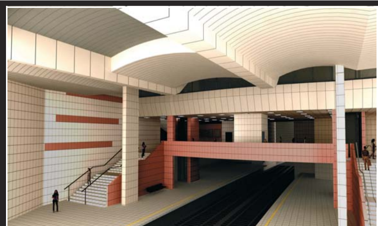
Така ще изглежда перонът на метростанцията при Львов мост (вляво). Тунелът от Надежда до Львов мост вече е готов (вдясно).